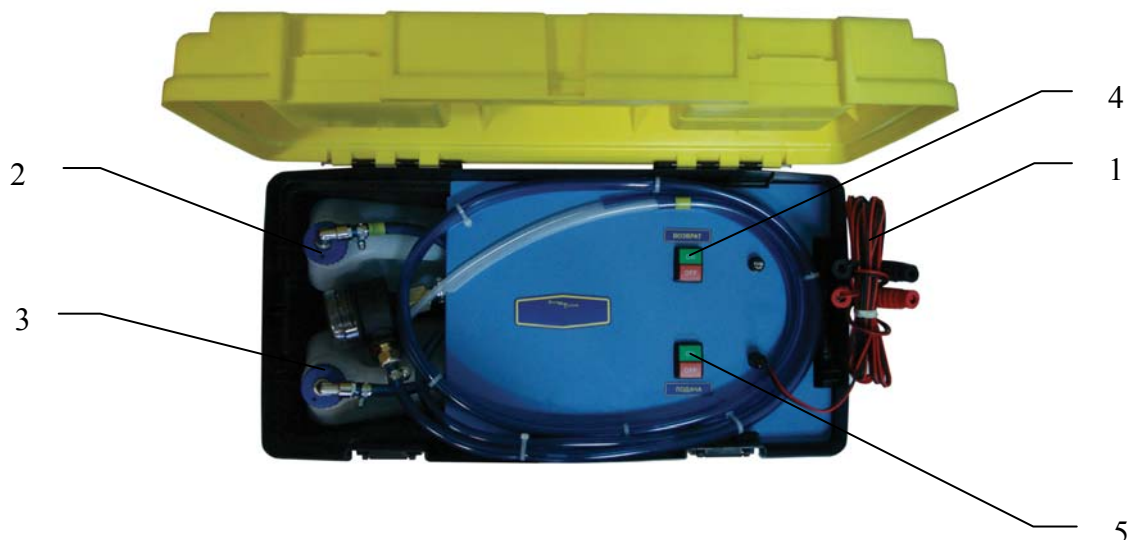
Рис.2 (вид сверху)