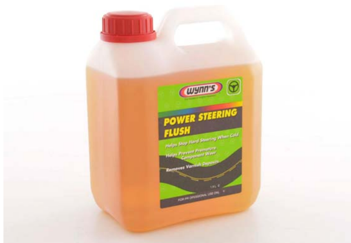
Рис.3 (WYNN'S Power Steering Flush)