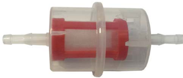
Рис.4 (неразборный сменный фильтр)